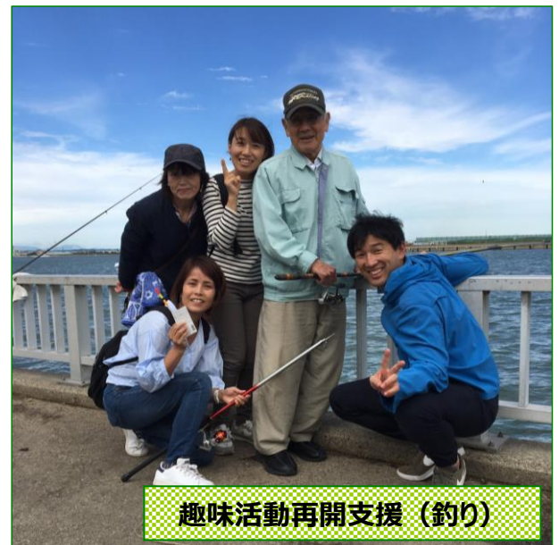
趣味活動再開支援 (釣り)