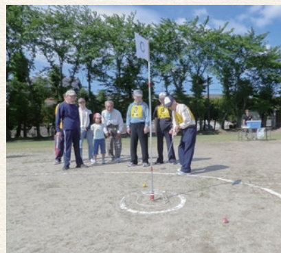
地域の人たちとのゲートボール大会（コロナ禍前）